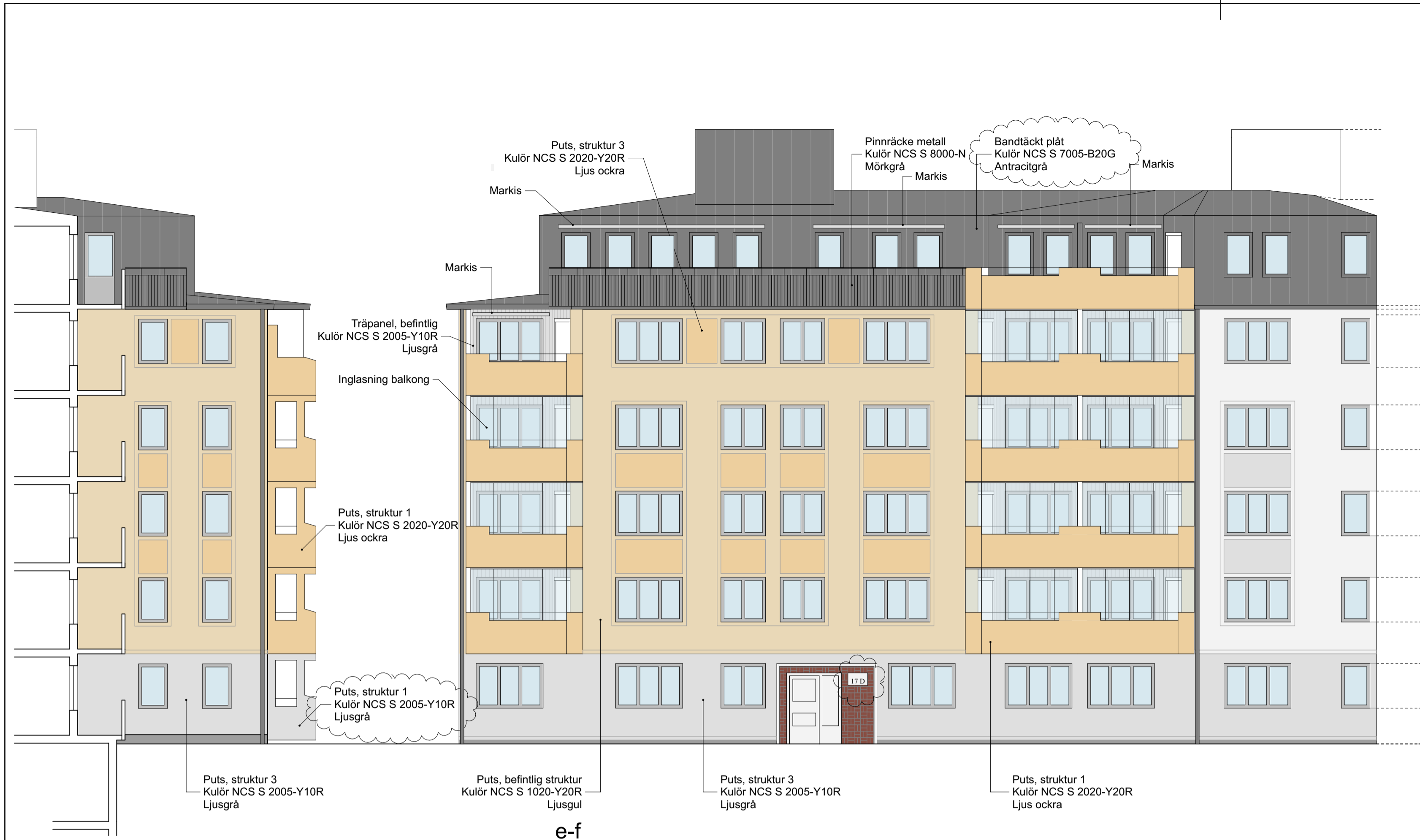
e-f FASAD MOT SYDVÄST