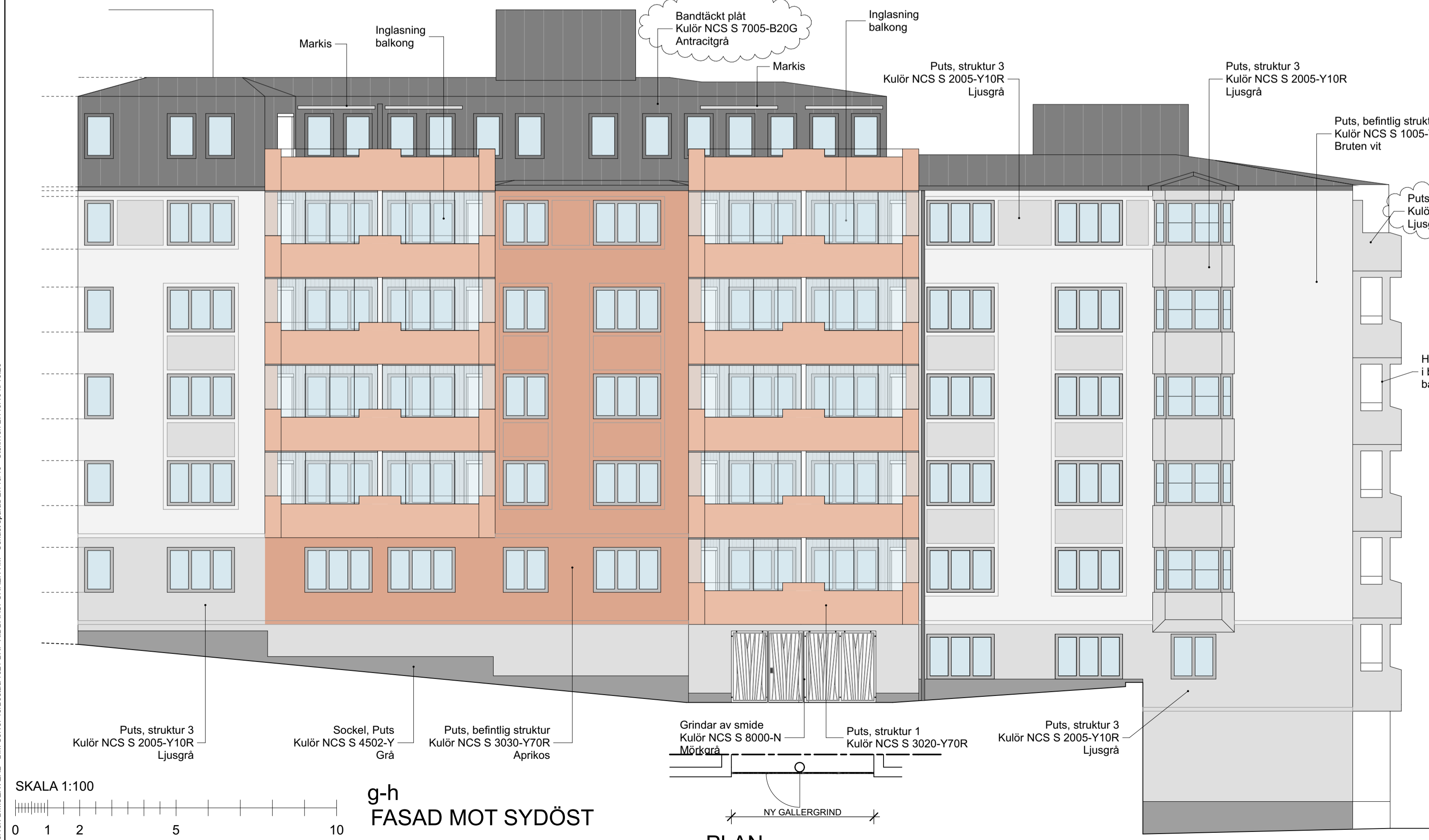
g-h FASAD MOT SYDÖST