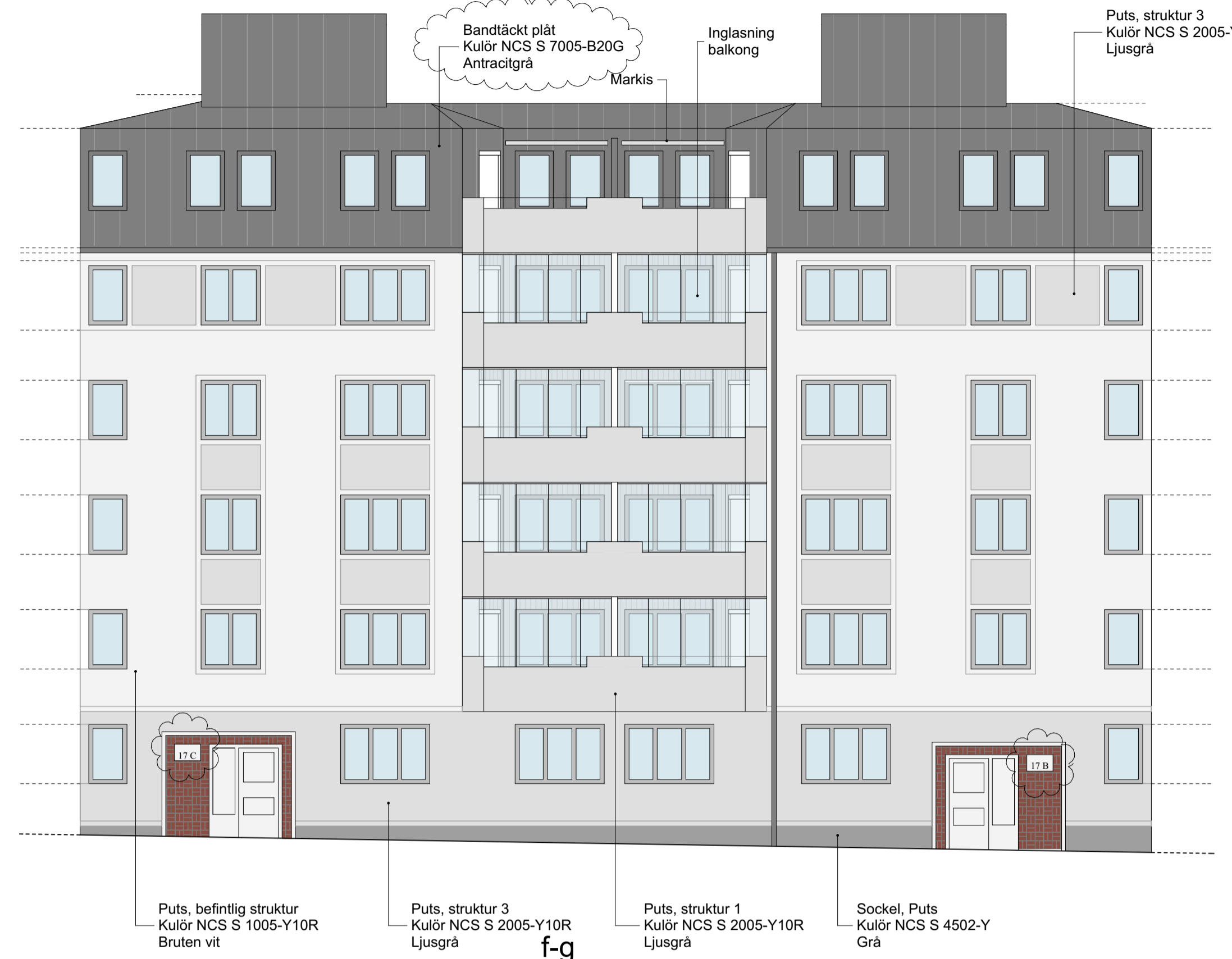
f-g FASAD MOT SÖDER